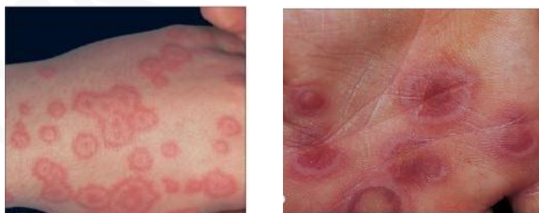
Ảnh 1. Hình bia bắn điển hình

Thương tổn đặc trưng của hồng ban đa dạng là hình bia bắn điển hình. Đó là những thương tổn hình tròn, đường kính dưới 3 cm, ranh giới rõ với da lành, được tạo nên bởi ít nhất 3 vòng tròn đồng tâm, hai vòng ngoài có màu sắc khác nhau bao quanh một tâm ở giữa sẫm màu (là nơi có sự phá hủy của thượng bì để hình thành nên một mụn nước hoặc vảy tiết).